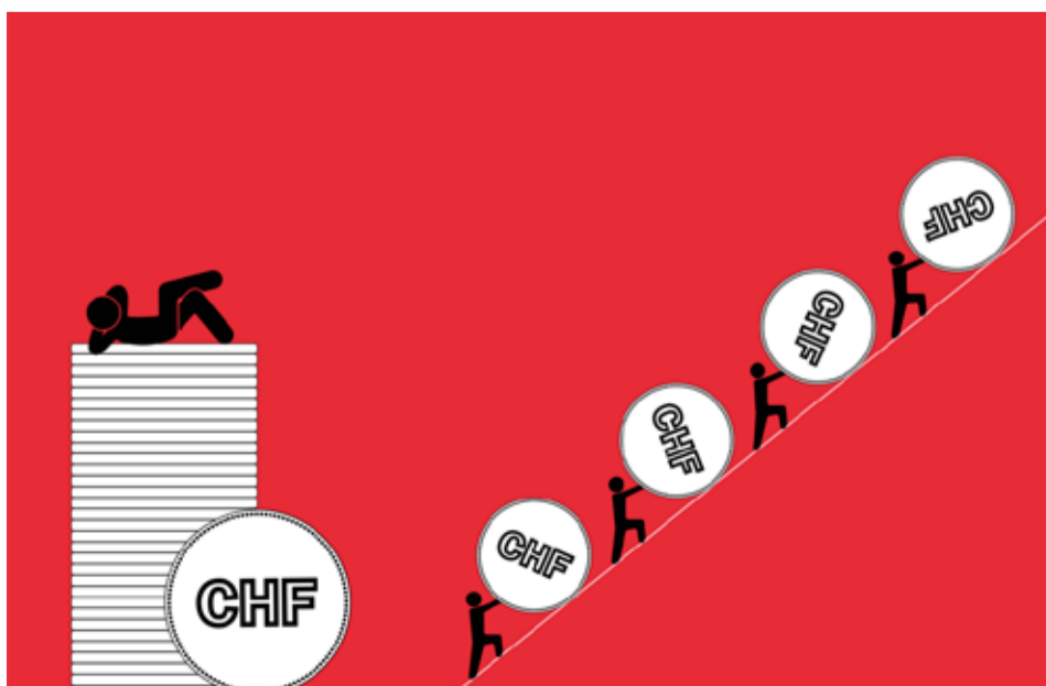
Neophodno povećanje plata kao sredstvo protiv poskupljenja

Uzme li se u obzir da su elementarni troškovi života naglo skočili, kao što su troškovi grijanja, bilo bi više nego fer da se i plate srazmjerno tome povećaju.