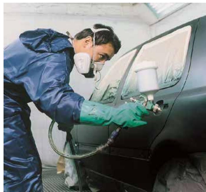
Zaposleni uslužnih djelatnosti zaslužuju bolje plate