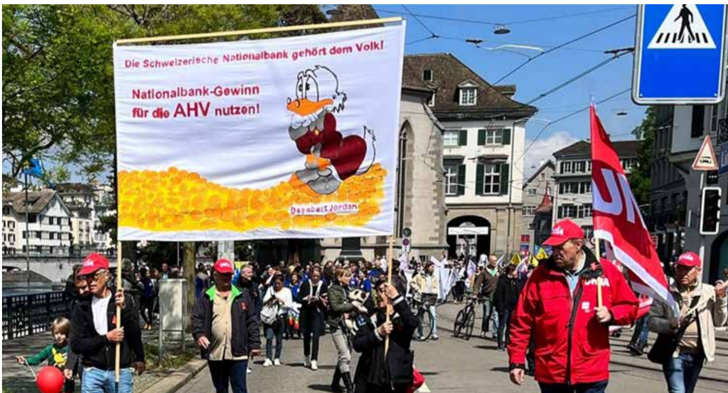
Sad moramo da se borimo protiv siromaštva u starosti

Manifest možete pročitati ovdje: Ferpa's Manifesto – Ferpa