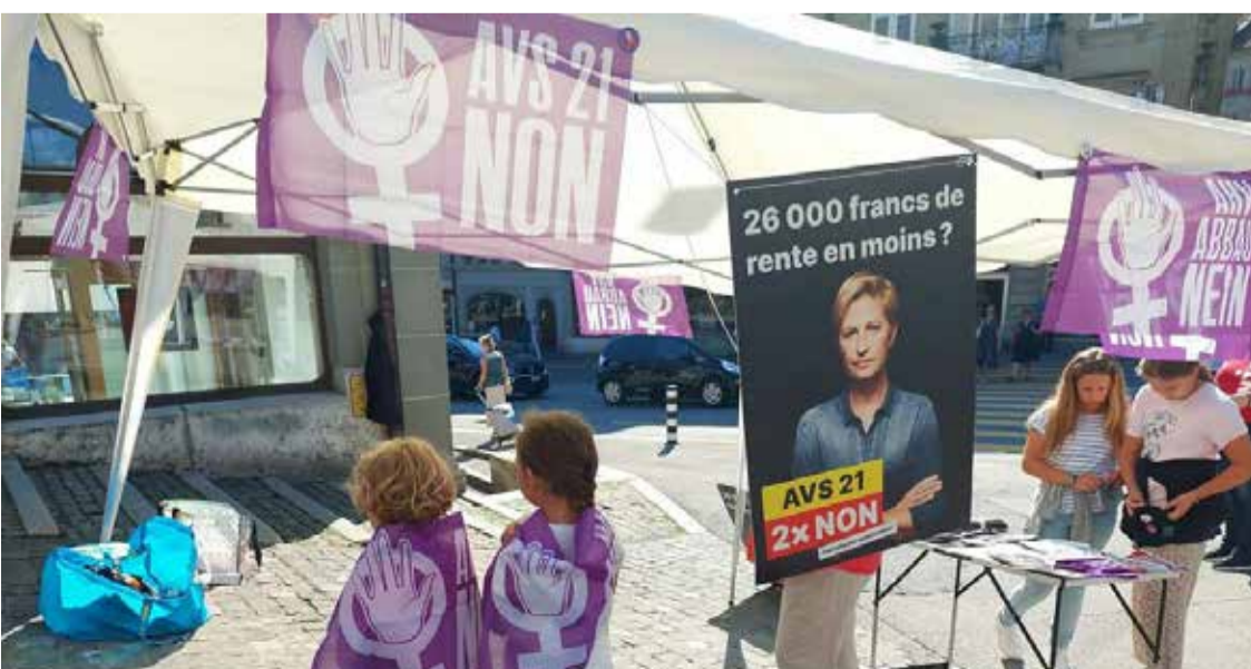
Samo siguran i jak prvi stub osiguranja daje nam sigurnost

ta, žene dobijaju daleko manje penzije. Oko četvrtina žena nakon penzionisanja živi samo od AHV-a. Mnoge od njih su primorane da žive u siromaštvu. Rješenje bi bilo da se ojača prvi stub, ali umjesto toga parlament želi da uštedi 7 milijardi preko leđa žena. Ovo razaranje AHV-a pogađa i muškarce. AHV 21 je u suštini samo prvi korak ka opštem pomjeranju starosne granice za penziju na 67 godina, pa čak i više. Pomjeranje granice ne donosi rješenja, naprotiv: osuđuje ljude na nezaposlenost i socijalnu pomoć.