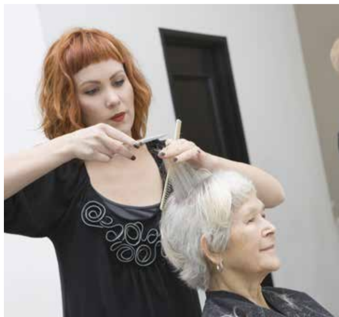
Bolji kolektivni ugovori štite radnike

Svima je jasno da je neophodan bolji GAV. Zbog toga su Unia i savez poslodavaca Coiffure Suisse za naredne mjesec dogovorili nove pregovore o GAV-u. Frizeri zajedno sa Unijom zahtijevaju veće plate i bolje uslove rada koje će im omogućiti usklađivanje privatnog života i posla.